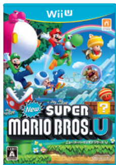
(New スーパーマリオブラザーズ U)