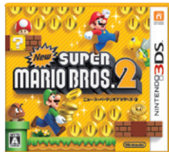
（New スーパーマリオブラザーズ 2）