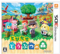
(とびだせ どうぶつの森)