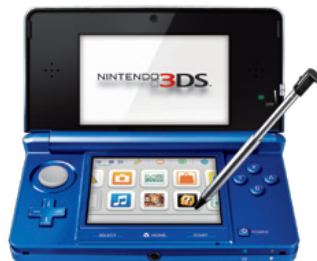
〔ニンテンドー3DS(コバルトブルー)〕