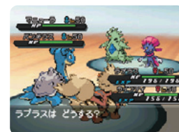
(ポケットモンスターブラック2) (ポケットモンスターホワイト2)