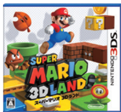
（スーパーマリオ 3Dランド）