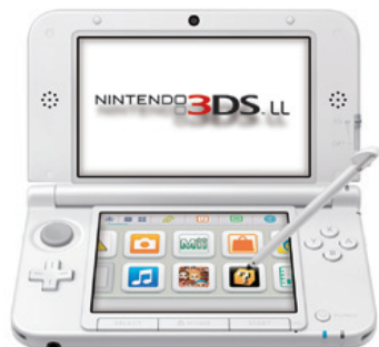
〔ニンテンドー3DS LL(ホワイト)〕

また、ソフトウェアについては、シンプルな操作で簡単にプレイができる横スクロールのアクションゲーム『New スーパーマリオブラザーズ 2』をパッケージ版とダウンロード版の2つの形態で販売し、300万本を超えるヒットとなりました。このほか、前期に発売した『スーパーマリオ 3Dランド』、『マリオカート7』などの定番タイトルも好調であったことに加え、サードパーティーのタイトルからもヒット作が生まれたことなどにより、ソフトウェアの販売本数は1,903万本となりました。