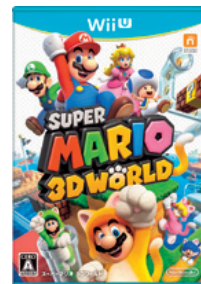
(スーパーマリオ 3Dワールド)