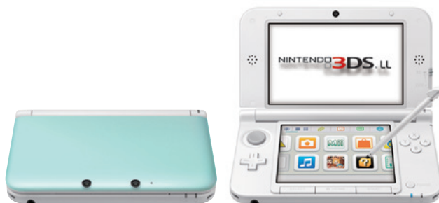
〔ニンテンドー3DS LL(ミント×ホワイト)〕

平素は格別のご高配を賜り、厚く御礼申し上げます。 当社グループの第74期中間期（平成25年4月1日から平成25年9月30日まで）の決算を行いましたので、その概要をご報告申し上げます。