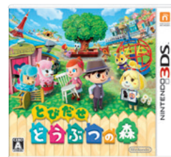
（とびだせ どうぶつの森）