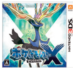
(ポケットモンスター X・Y)

これらの取組みのもと、引き続き社業の発展に邁進する所存でございますので、株主の皆様におかれましては、今後ともご支援、ご鞭撻を賜りますようお願い申し上げます。