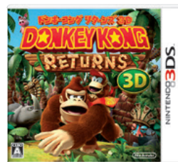
（ドンキーコングリターンズ3D）