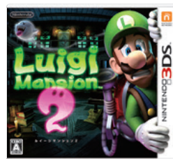
（ルイージマンション2）