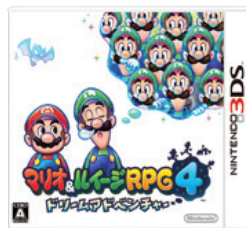
（マリオ&ルイージRPG4 ドリームアドベンチャー）