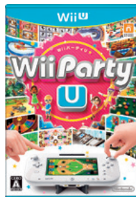
(Wii Party U)