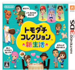
（トモダチコレクション 新生活）

当中間期（第2四半期連結累計期間）の状況は、ニンテンドー3DS（3DS LL/3DS/2DS）では、国内においては4月に発売した『トモダチコレクション 新生活』が163万本の販売となったほか、サードパーティーのタイトルからもヒット作が生まれており、国内市場は引き続き好調を維持しております。海外市場においては、6月に欧米で発売した『とびだせ どうぶつの森』が201万本（全世界で249万本）を販売し、前期に発売した『ルイージマンション2』や、当期に発売した『マリオ&ルイージRPG4 ドリームアドベンチャー』、『ドンキーコングリターンズ3D』といったタイトルも堅調に推移しました。これらにより、販売数量は、ハードウェアが389万台、ソフトウェアが2,738万本となりました。