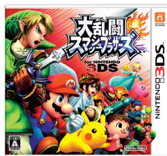
(大乱闘スマッシュブラザーズ for ニンテンドー3DS)

Wii Uでは、5月に全世界で発売した『マリオカート8』が順調に推移したほか、9月に海外で発売した『ゼルダ無双』が人気となり、販売数量はハードウェアが112万台、ソフトウェアが940万本となりました。