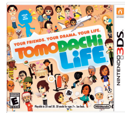
(トモダチコレクション 新生活) ※海外版パッケージ