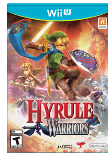
(ゼルダ無双) ※海外版パッケージ