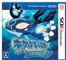
(ポケットモンスター オメガルビー・アルファサファイア)