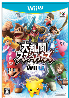
(大乱闘スマッシュブラザーズ for Wii U)