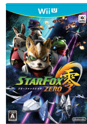
スターフォックス ゼロ

amiiboについては、ラインアップが充実してきている中で『どうぶつの森 amiiboフェスティバル』の発売に合わせて11月より新たにどうぶつの森シリーズのフィギュア型のamiiboを展開し、さらに日本では10月に発売したどうぶつの森シリーズのカード型のamiibo第2弾などにより、amiiboのさらなる販売拡大を目指します。