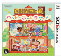
どうぶつの森 ハッピーホームデザイナー