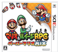
マリオ & ルイージRPG ペーパーマリオMIX

Wii Uでは、好調に推移している『スーパーマリオメーカー』、『Splatoon (スプラトゥーン)』の話題性を維持させ、年末商戦に向けてさらなる販売拡大を目指します。また、amiiboを使って遊ぶ『どうぶつの森 amiiboフェスティバル』を11月に全世界で発売し、そのほか、『マリオテニス ウルトラスマッシュ』、『スターフォックス ゼロ』などの新作ソフトを順次発売します。