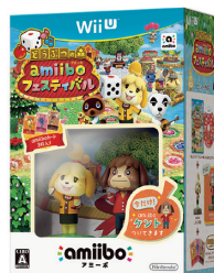
どうぶつの森 amiiboフェスティバル

Wii Uでは、好調に推移している『スーパーマリオメーカー』、『Splatoon (スプラトゥーン)』の話題性を維持させ、年末商戦に向けてさらなる販売拡大を目指します。また、amiiboを使って遊ぶ『どうぶつの森 amiiboフェスティバル』を11月に全世界で発売し、そのほか、『マリオテニス ウルトラスマッシュ』、『スターフォックス ゼロ』などの新作ソフトを順次発売します。