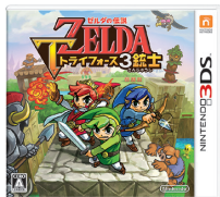
ゼルダの伝説 トライフォース 3 銃士

ニンテンドー3DSでは、10月に全世界で『ゼルダの伝説 トライフォース 3 銃士』を発売したほか、『マリオ & ルイージ RPG ペーパーマリオMIX』を12月に日本と欧州で発売します。また、日本で9月に発売した『ポケモン 不思議のダンジョン』を11月に米国で発売し、来年初頭には欧州で発売を予定しています。また、サードパーティーからも複数の有力タイトルの発売が予定されており、ニンテンドー3DSのより一層の普及を目指します。