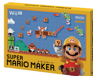
スーパーマリオメーカー

これらの状況により、売上高は2,041億円（うち、海外売上高1,446億円、海外売上高比率70.9%）、営業利益は89億円となりました。また、受取利息などの営業外収益が75億円発生したことなどにより、経常利益は164億円、親会社株主に帰属する中間純利益は114億円となりました。