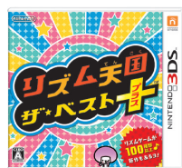
リズム天国 ザ・ベスト+

Wii Uでは、スーパーマリオシリーズの新たな提案として9月に全世界で発売した『スーパーマリオメーカー』が188万本と好調なスタートを切りました。また、5月に発売した『Splatoon（スプラトゥーン）』が242万本のヒットとなりプラットフォームの活性化に貢献したことなどにより、ハードウェアの販売台数は119万台、ソフトウェアの販売本数は1,237万本となりました。