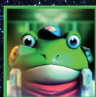
スリッピー・トード