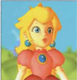
クッパ城に飛ばされる直前のピーチ姫の姿

昨日遊園地で行われた「スカイライド・キャノン（大砲）」の発表会において、 ピーチ姫 が、クッパ城に飛ばされるといふアクシデントが発生した。「球化マシン」（下参照）でボールの形になった人をターゲットへ発射して楽しむという夢のマシン、スカイライド・キャノンは、今回の一件で出だしからつまづいてしまった。